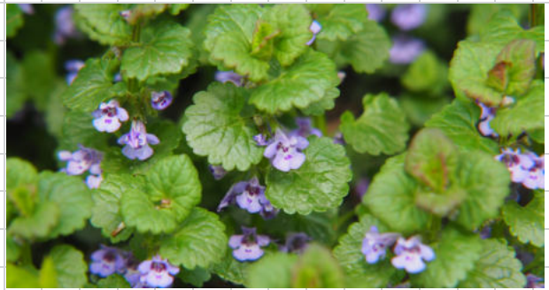
1.) Gundermann - Blätter und Blüten

https://www.kostbarenatur.net/ anwendungen-und-inhaltsstoffe/ gundermann/#google_vignette